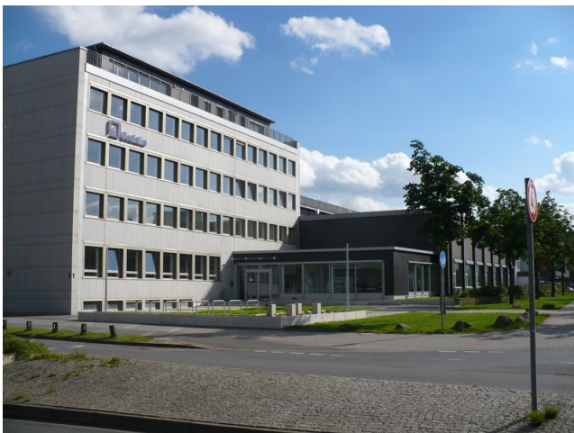
Ein neues Zuhause

Am 21. Oktober wurde in der Siegfried-Ehlers-Straße 1 in Wolfsburg das ehemalige Haus des Deutschen Gewerkschaftsbundes (DGB) seiner neuen Bestimmung übergeben. Das mehrgeschossige Haus ist nun ein Hochschulgebäude und erweitert den Gebäudekomplex, der den Campus der Ostfalia Hochschule für angewandte Wissenschaften in Wolfsburg bildet.