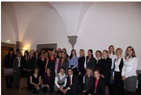
Gruppenbild AbsolventInnen 2010

Am 5. November hieß es wieder „G trifft ...“ und dieses Jahr erstmals im Gartensaal des Wolfsburger Schlosses. Das Thema des Kontaktstudenttages lautete „Bachelorabschluss – ein Jahr danach“. AbsolventInnen berichteten von ihren Erfahrungen im ersten Jahr nach ihrem Bachelorabschluss.