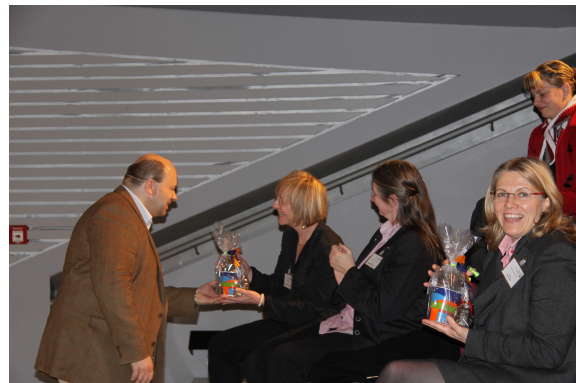
Dank an die Referentinnen

Mit ReferentInnen aus Südafrika, Finnland, Frankreich, Österreich und Deutschland wagte die Tagung „Pflege international“ den „Blick über den Tellerrand“ und regte die rund 120 TeilnehmerInnen (Studieninteressierte des neuen Studiengangs „Pflege“, Auszubildende in den Pflegeberufen, Pflegefachkräfte, Leitungskräfte in der Pflege, Lehrkräfte an Pflegeschulen, Studierende unserer Fakultät sowie FachkollegInnen benachbarter Hochschulen) zum Nachdenken, Umdenken und Diskutieren an.