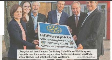
Übergabe auf dem Campus: Der Rotary Club Gifhorn-Wolfsburg verdoppelte den Spendenbetrag aus einer Podiumsdiskussion von Hochschule Ostfalia und Volkshochschule Wolfsburg.