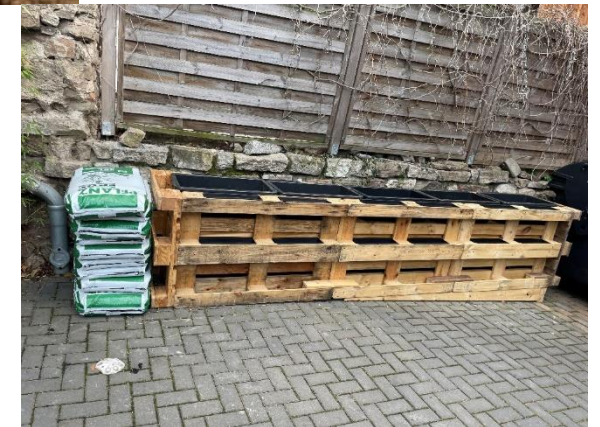
Selbstgebaute Hochbeete aus Paletten