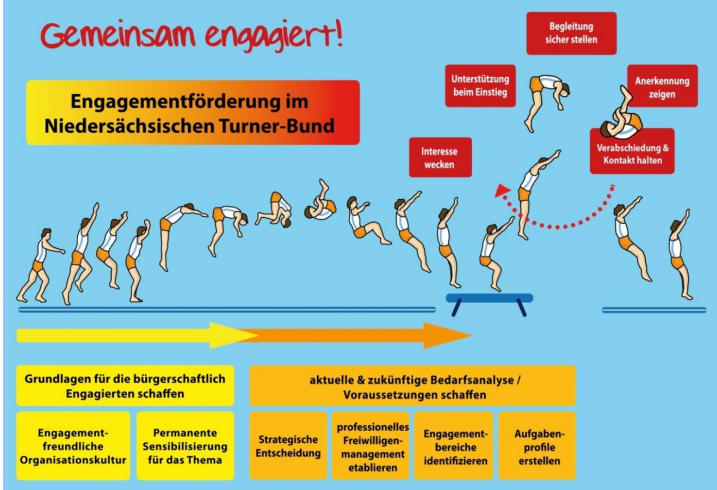
Abbildung 1: Konzept der Engagementförderung im Niedersächsischen Turner-Bund e. V.