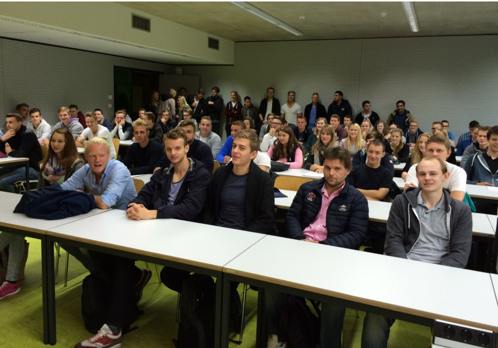
Bild des Quartals: Offizielle Begrüßung der Erstsemesterstudierenden Sportmanagement